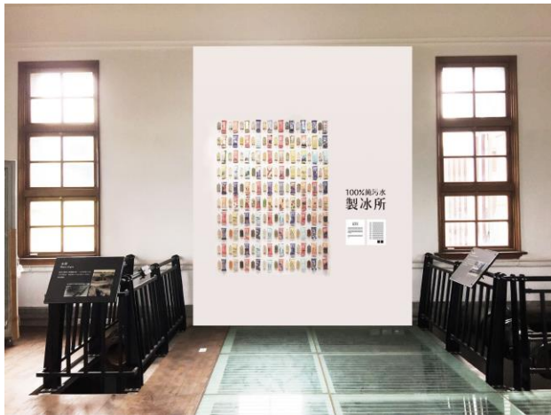
圖一：新竹市水資源冰棒將在取水口館展出（示意圖）

#新竹水道取水口館 #水資源環境教育展 #100%純污水製冰所 #新竹水資源冰棒 #古蹟活化再利用