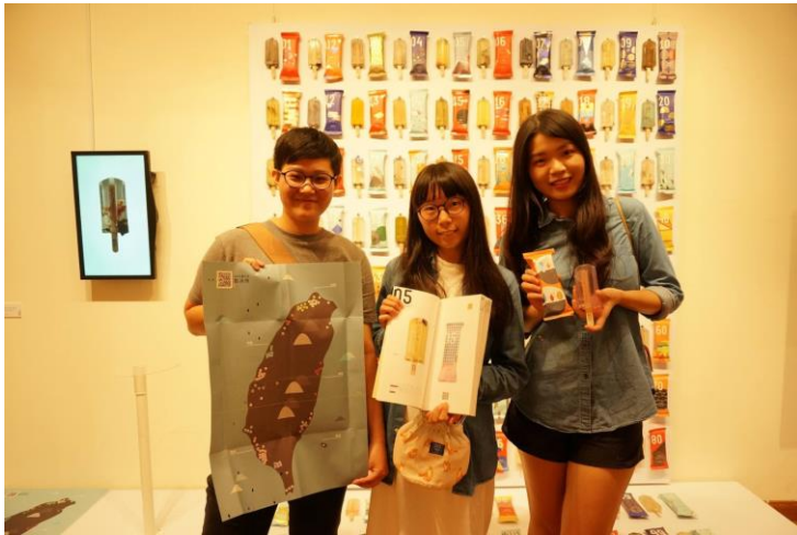
圖三：100%純污水製冰所團隊